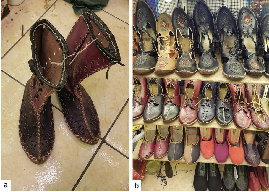
Resim 10. Farklı yüzey uygulamaları ile çizme ve yemeni görselleri a) dikiş, renk ve delme işlemleri ile farklı çizme b) farklı ajur, aplik ve renk uygulamaları ile yemeni görselleri