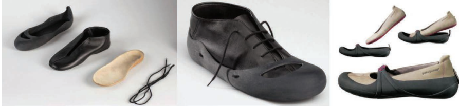
Resim 11. Farklı malzemeler ile yeni ayakkabı formları (www.intertek.com)

Ayakkabının, giyimin önemli bir parçası olması ve doğal kaynakların giderek azalması nedeniyle, üretimde alternatif malzemeler ile ihtiyaç karşılanmaya çalışılmaktadır. Doğal malzeme olarak kullanılan deri yerine kauçuk, yün, pamuk, polilaktik asit (PLA), bambu lifleri ve yenilenebilir lifler kullanılmaktadır (Resim 11). Ayak ile temas eden kısım doğal malzemelerden üretilirken diğer kısımlarda sentetik malzeme kullanılarak üretilen bir düz ayakkabı tasarımı yapılmıştır (www.intertek.com).