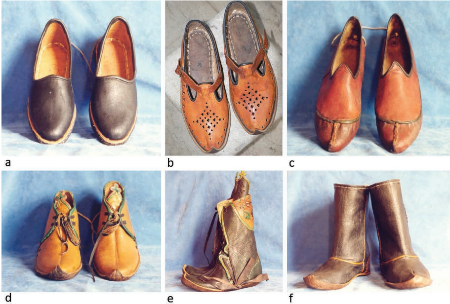
Resim 3. Yemeni görselleri a) Sade yemeni, b) Tokalı Osmanlı yemenisi, c) Saray yemenisi, d) Kelik, e) Nakışlı postal, f) Edik (Özkarıcı, 2012)

Kelik, koncu incik kemikleri üzerine çıkan, önden deri bağcıkla kapanan, postalın kısa olanı da denebilecek, ayakkabı türüdür. Kelik, Osmanlı döneminde çok giyi-