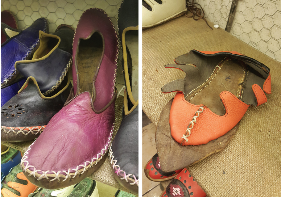
Resim 2. Dikim aşamasındaki yemeni ve dikim işlemi bitmiş yemeni (Kuru ve Paksoy, 2014)

Gaziantep, Kilis haricindeki diğer illere de yayıldığı bildirilmektedir (Özkarıcı, 2012).