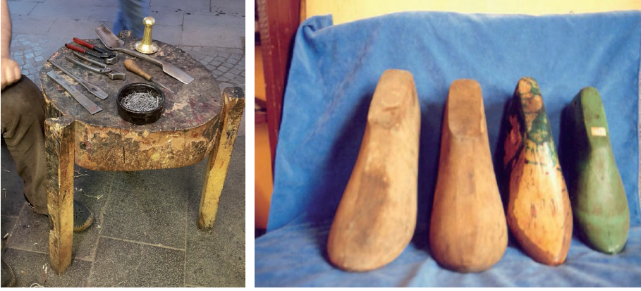
Resim 4. Köşker kütüğü